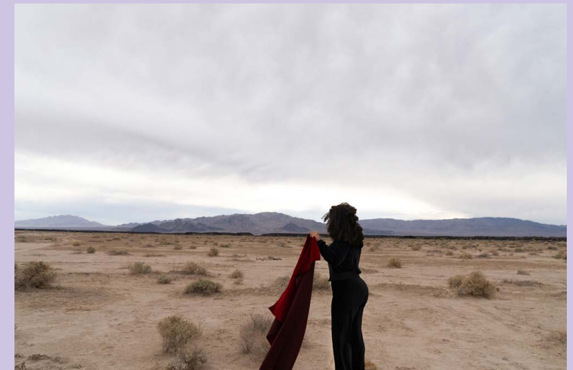
„welcome everybody to the Wild wild west“ von Verdiana Albano