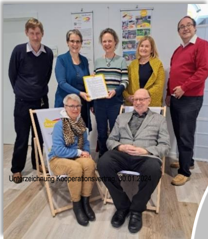
Unterzeichnung Kooperationsvertrag 30.01.2024

Nach der erfolgreichen zweijährigen Erprobungsphase 2021 – 2023 mit fast 100 mobilen Einsätzen an vielen unterschiedlichen Orten rollt das AnsprechBarMobil in die nächste Phase. Das Fahrzeug wurde 2024 gekauft und der Kooperationsvertrag unterzeichnet. Drei Träger zeichnen für die kommenden Jahre verantwortlich, dass das Projekt einer „Geh-Hin-Kirche“, die auf Augenhöhe mit und zu den Menschen unterwegs ist, gut weitergehen kann – offen, vielfältig, niederschwellig, experimentierfreudig und immer mit Kooperationspartnern aus den unterschiedlichsten Feldern unserer Gesellschaft. Wir sind davon überzeugt: Nur im Miteinander und im Dialog werden wir die vielen Herausforderungen der heutigen Zeit meistern können!